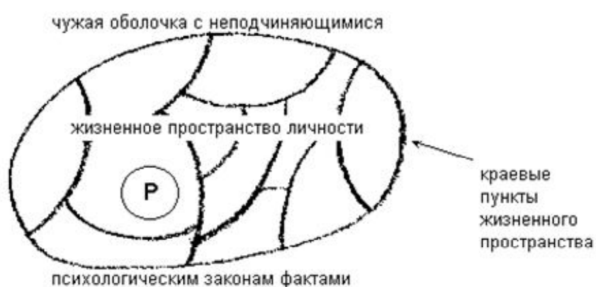
Рис. 5.6. Жизненное пространство субъекта (P), в краевых точках которого начинается "чужая оболочка" не подчиняющихся психологическим законам фактов [К. Lewin, 1969, S. 90]

феноменально и должны всё понять, опираясь только на это. Однако независимо от переживаемого нами существует реальный, т. е. непсихологический, физический мир (в том числе и наше собственное тело). События в этом мире подчинены не психологическим, а физическим законам. Через собственные действия мы можем влиять на физический мир, а он постоянно воздействует на феноменально данный психологический мир, скажем на восприятие. Вопрос о том, где осуществляется переход от одного мира к другому, затрагивает важнейшие аспекты психофизической проблемы. В своей модели Левин представлял непсихологический мир начинающимся в так называемых краевых точках жизненного пространства и обозначал их как "чужую оболочку". Как показывает рисунок 5.6, сюда относятся, по Левину, все так называемые "факты, которые не подчиняются психологическим законам", это физические и социальные явления (примером социальных могут служить действующие в той или иной стране законы).